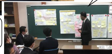
第1グループの討議の様子