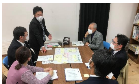
第2グループからの全体発表